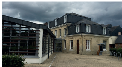
La Maison du territoire de Saint-Romain-de-Colbosc

Des postes informatiques en libre service vous simplifient l'accès à l'information et aux démarches administratives. Des agents spécialisés sont à votre service pour vous aider.