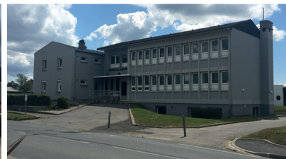
La Maison du territoire de Criquetot-l'Esneval