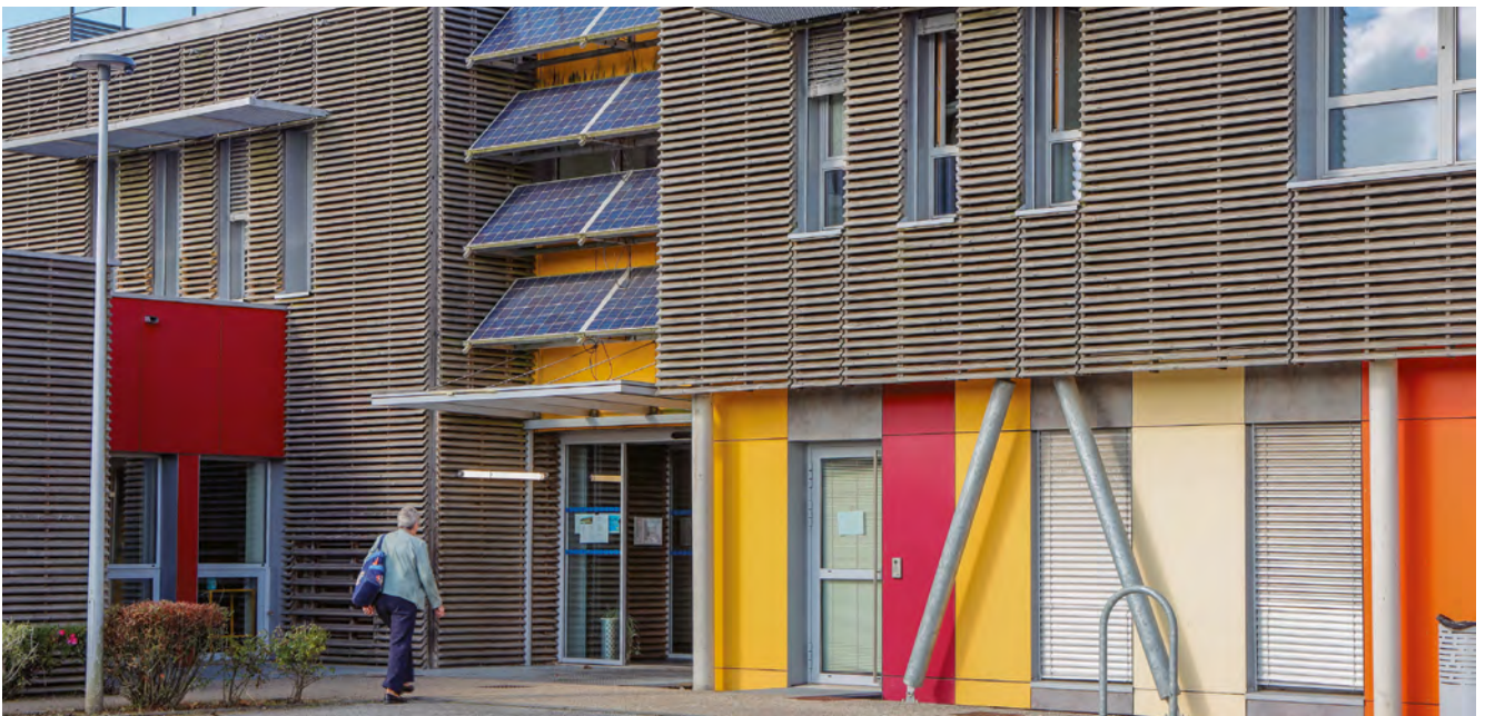
La Maison de Santé de Saint-Romain-de-Colbosc

Bien que facultative, Le Havre Seine Métropole fait de sa compétence en matière de santé une priorité pour l'accès aux soins des habitants, la formation de futurs professionnels ou encore la prévention auprès des jeunes et du plus grand nombre, en collaboration avec l'ensemble des partenaires santé du territoire.