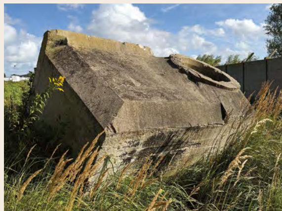
Le bunker allemand Tobrouk à Gonfreville-l'Orcher

Avec le soutien de la Région Normandie, la Communauté urbaine mène, jusqu'à l'été 2026, une opération d'inventaire des vestiges de la Seconde Guerre mondiale en vue de « rendre visible l'invisible » et de participer à la préservation d'un patrimoine souvent méconnu. L'occasion de découvrir si des éléments architecturaux ou graphiques relèvent ou non de cette époque, nombre de traces du dernier conflit mondial ayant été oubliées ou dissimulées. Les archives écrites ou photographiques, les sources françaises, alliées ou allemandes rendent parfois possible l'identification. L'objectif est d'en savoir plus sur le rôle du territoire et de recenser tout vestige susceptible d'être valorisé sur le plan patrimonial. Le Pays d'art et d'histoire Le Havre Seine Métropole gère cet inventaire sur lequel peut s'appuyer, dans la durée, le développement des activités du label (expositions, publications, actions de médiation, formation des guides...). De juin 2023 à juin 2024, plus de 320 ouvrages ont ainsi été répertoriés sur la seule commune du Havre. N'hésitez pas à vous manifester.