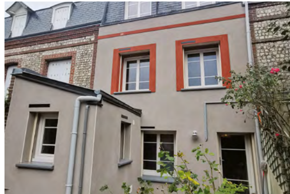
Deux projets de rénovation réalisés au Havre (à gauche) et à Étretat

V ous habitez Le Havre Seine Métropole et êtes propriétaire ou locataire d'un bien immobilier (maison individuelle ou appartement en copropriété) sur le territoire ? Une équipe dédiée et qualifiée d'agents de la Communauté urbaine facilite vos projets de travaux de rénovation énergétique, d'autonomie à domicile, de prévention des dégradations ou encore d'accessibilité. Du conseil initial à la réalisation, en passant par la recherche de financements, le guichet unique, entièrement gratuit, offre un accompagnement technique et financier à la fois neutre et indépendant, agréé Mon Accompagnateur Rénov'. Chaque année, plus de 2000 particuliers sollicitent son intervention, tant en ligne qu'au téléphone ou encore lors des permanences hebdomadaires assurées dans les deux Maisons du territoire de Criquetot-l'Esneval et de Saint-Romain-de-Colbosc. Votre conseiller vous oriente alors vers les bouquets de travaux les plus pertinents, identifie avec vous les aides financières éligibles et vous accompagne dans le financement du reste à charge. Les ménages bénéficient également, au sein des Maisons du territoire, d'une aide aux démarches à effectuer en ligne.