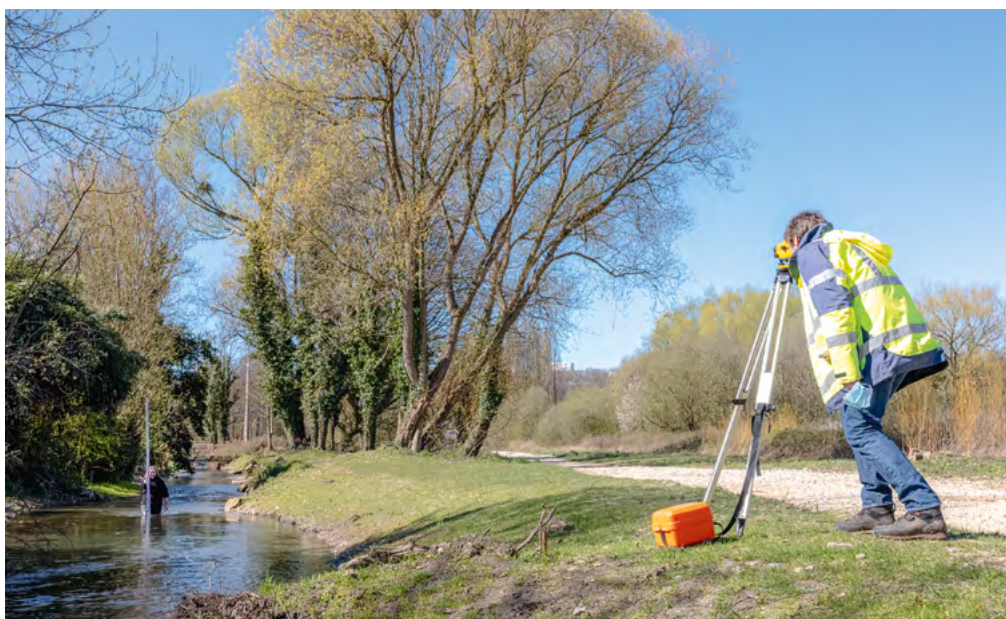
Le niveau de l'eau sous surveillance le long de nos cours d'eau

Le Havre Seine Métropole gère l'approvisionnement en eau potable de l'ensemble des foyers des 54 communes membres. Suivi des nappes phréatiques, pompage, traitement et acheminement, une attention de chaque instant souligne l'enjeu d'un geste quotidien qui n'a rien de banal.