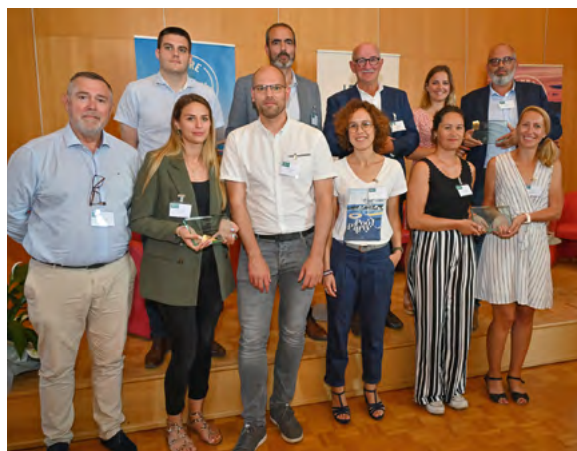
Les représentants des entreprises lauréates lors de la remise des prix

L'entreprise familiale a souhaité mettre en place une démarche personnalisée pour que chacun de ses salariés