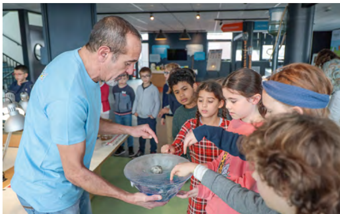
Bien connaître l'eau grâce à l'Écopôle Cycle de l'eau