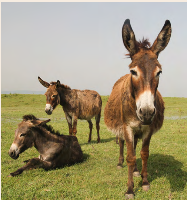
Les Doyens, un des spectacles du festival Ad Hoc

La 6 e édition du festival jeune public revient du 2 au 9 décembre 2023. Ad Hoc, c'est huit jours de festivités destinées aux enfants, aux classes et aux familles, au tarif unique de 5 € par spectacle, à travers douze communes : Angerville-l'Orcher, Criquetot-l'Esneval, Gainneville, Gonfreville-l'Orcher, La Remuée, Le Havre, Manéglise, Montivilliers, Saint-Romain-de-Colbosc, Saint-Jouin-Bruneval, Sandouville et Turretot.