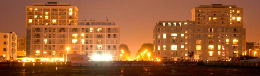
Le Havre, la Porte Océane