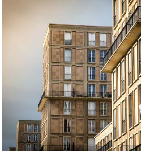
Le Havre, le centre reconstruit