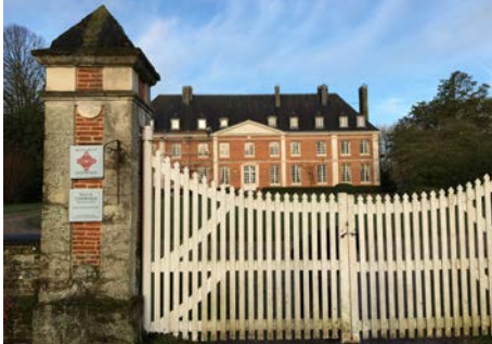
Cuverville-en-Caux, le manoir