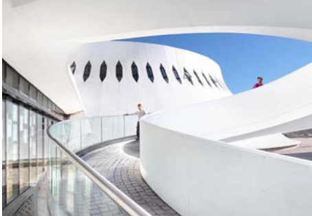
Le Havre, le Volcan

🕒 2 h - 7 € / 5 €* - Réservation obligatoire