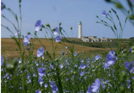
La Poterie Cap d'Antifer, le phare

Vous souhaitez participer à ce projet, contactez : lescueilleursdhistoires@gmail.com 06 50 12 43 75 - lescueilleursdhist.wixsite.com/etretatmonpaysage