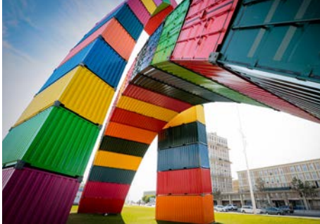
Vincent Ganivet, Catène de containers