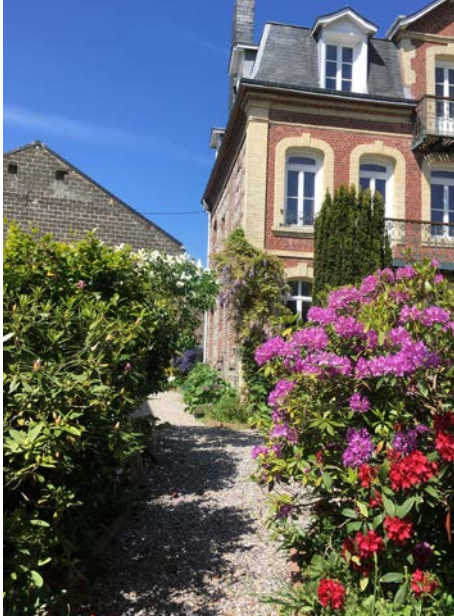
Étretat, le centre bourg

🕒 1 h 30 - Gratuit - Réservation obligatoire