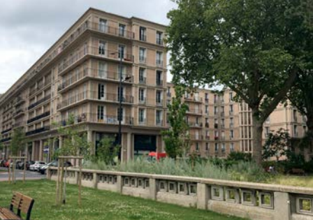
Le Havre, avenue Foch