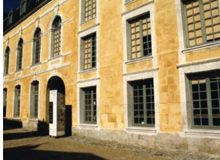
Montivilliers, cité des abbesses

Réservation obligatoire : 02 35 30 96 66 - contact@abbaye-montivilliers.fr