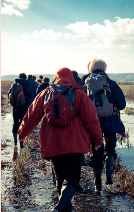
L'estuaire de la Seine

À partir de 10 ans - 🕒 2 h 30 / 3 h (5,5 km) - Gratuit Réservation obligatoire - Chaussures de marche indispensables - plusieurs dénivelés importants Possibilité d'apporter son pique-nique pour une fin de parcours vers 12 h au pied du phare.