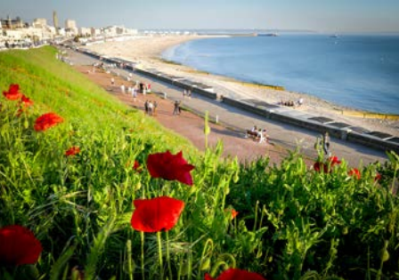
Sainte-Adresse/Le Havre, le front de mer