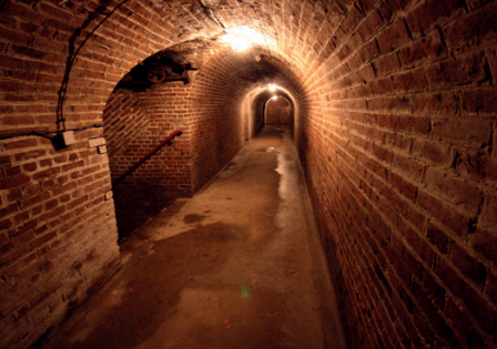
Batterie de Dollemard, Sainte-Adresse