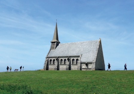
Chapelle Notre-Dame-de-la-Garde, Étretat