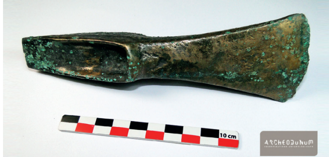
Hache de l'Âge de bronze, Oudalle