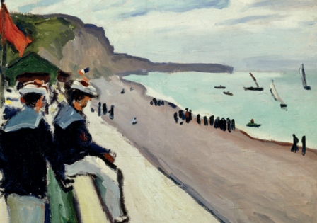
La plage de Fécamp, Albert Marquet, 1096, Centre Pompidou