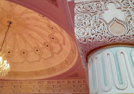
Mosquée de Caucraiuville, Le Havre