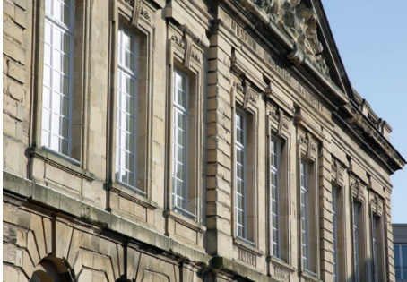
Muséum d'histoire naturelle, Le Havre