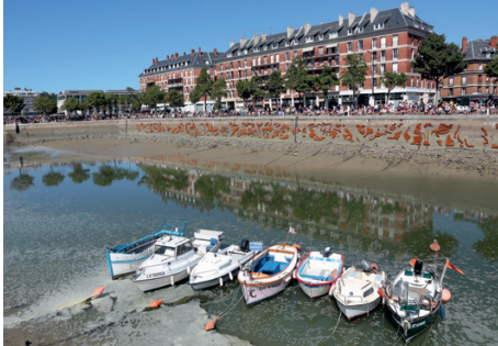
Quartier Saint-François, Le Havre