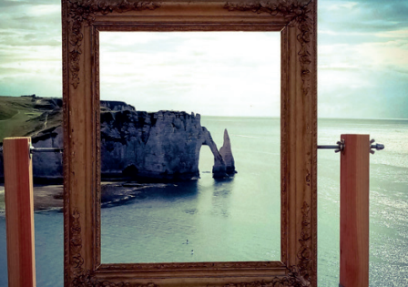
Falaise d'Amont, Étretat