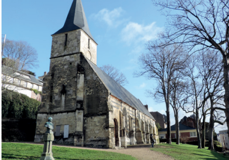
Chapelle Saint-Michel d'Ingouville, Le Havre