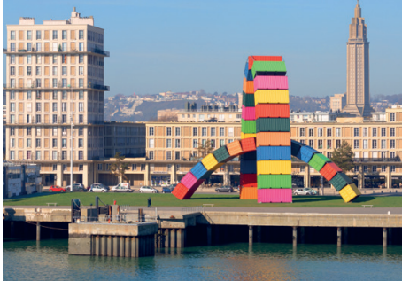
La Catène, Le Havre - Vincent Ganivet