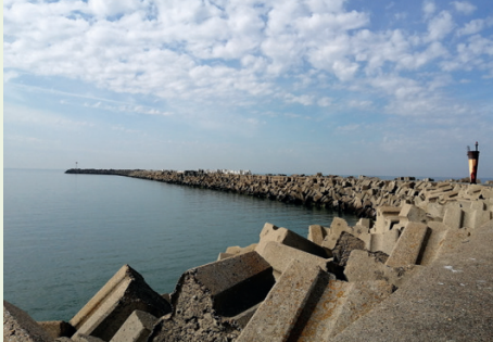
Port d'Antifer, Saint-Jouin-Bruneval