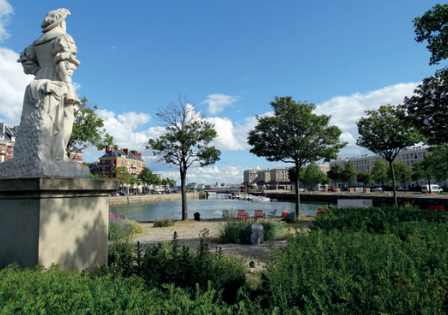
Bassin du Roy, Le Havre