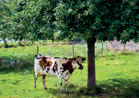
Vache sous les pommiers, pays de Caux