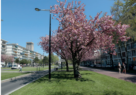
Avenue Foch, Le Havre