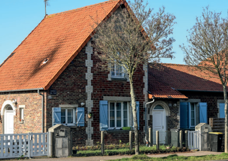
Cité-jardin d'Aplemont, Le Havre