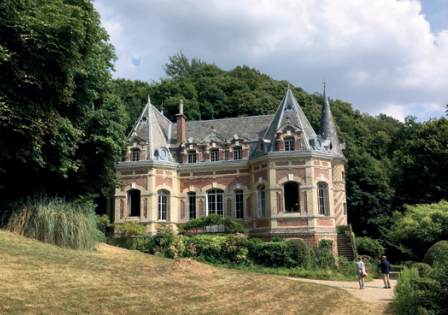
Château des Aygues, Étretat