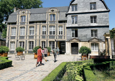
Hôtel Dubocage de Bléville, Le Havre