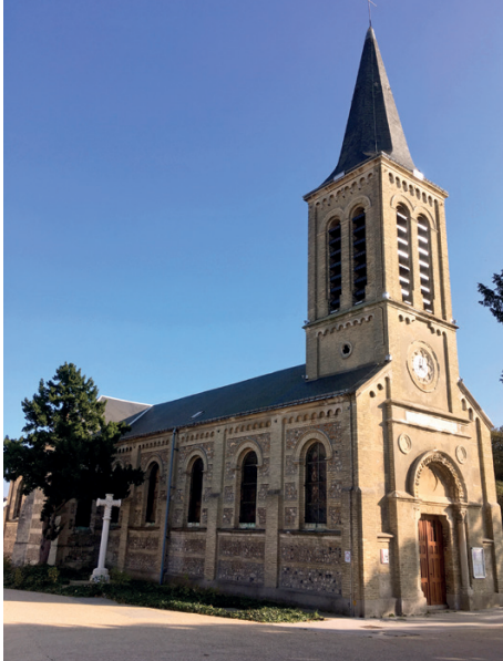
Église Saint-Erkonwald, Gonfreville-l'Orcher