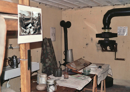
Central téléphonique, Le Havre