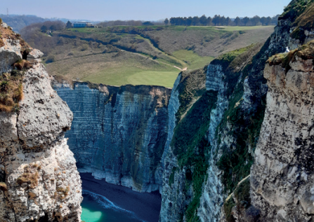
Falaise d'Aval, Étretat