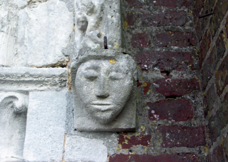
Église Saint-Gilles-Saint-Leu, Saint-Gilles-de-la-Neuville