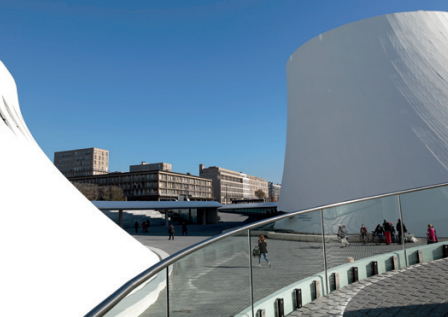
Espace Oscar Niemeyer, Le Havre