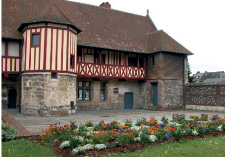
Musée du prieuré, Harfleur