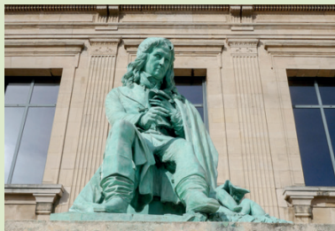
Statue de Bernardin de Saint-Pierre, Le Havre

* Détail de la tarification Pays d'art et d'histoire, voir Mode d'emploi p. 44