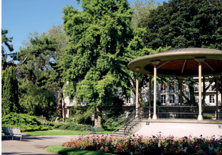
Square Saint-Roch, Le Havre