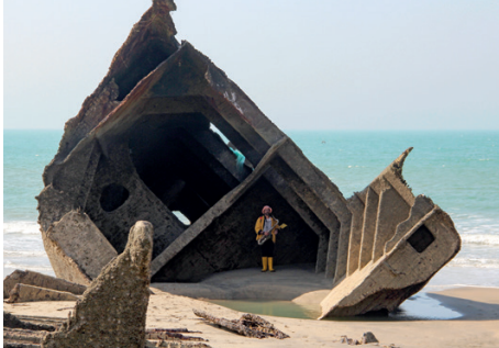
Une grenouille à l'OTAN, Octeville-sur-mer