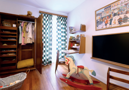
Appartement témoin Perret, Le Havre