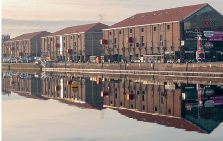
Les Docks, Le Havre