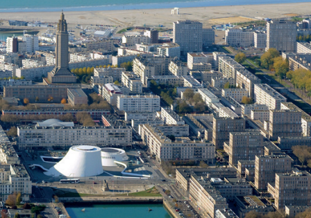
Centre reconstruit, Le Havre