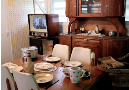
Maison du patrimoine et des cités provisoires, Gonfreville-l'Orcher