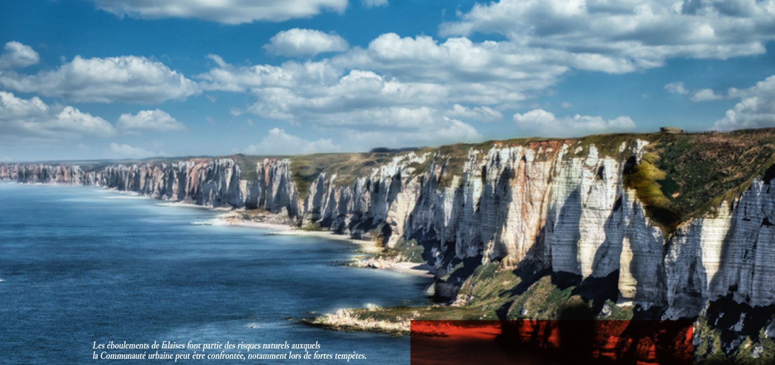
Les éboulements de falaises font partie des risques naturels auxquels la Communauté urbaine peut être confrontée, notamment lors de fortes tempêtes.

tous les acteurs, via le maintien et le développement de la culture du risque. Bien informé, le citoyen devient le principal acteur de sa sécurité.