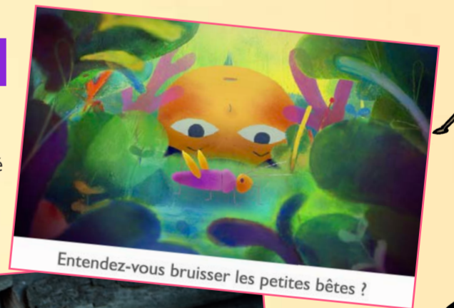
Entendez-vous bruisser les petites bêtes ?