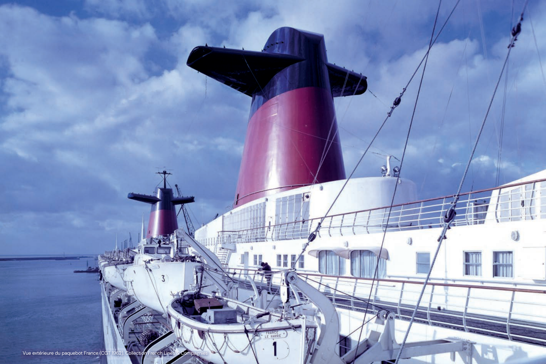
Vue extérieure du paquebot France (CGT 1962).