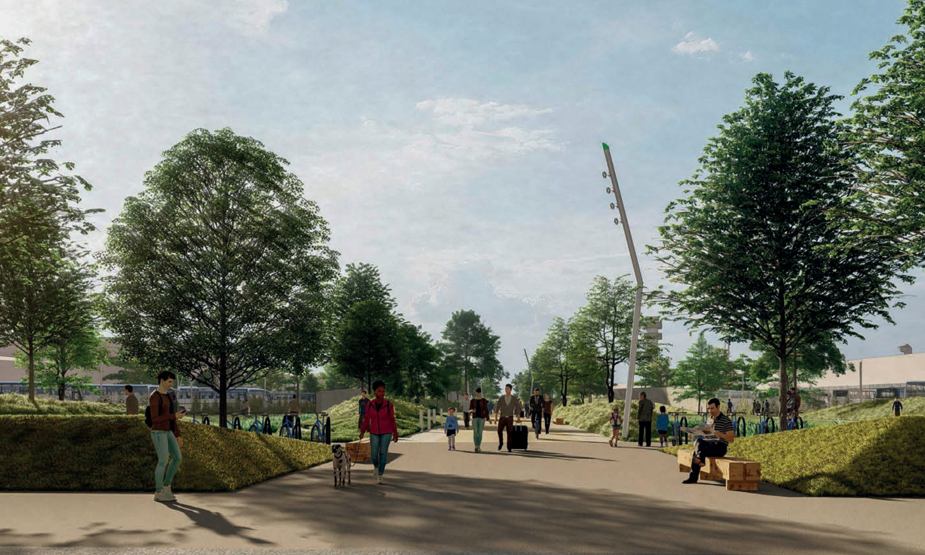
Vue de l'allée piétonne de la pointe de Floride