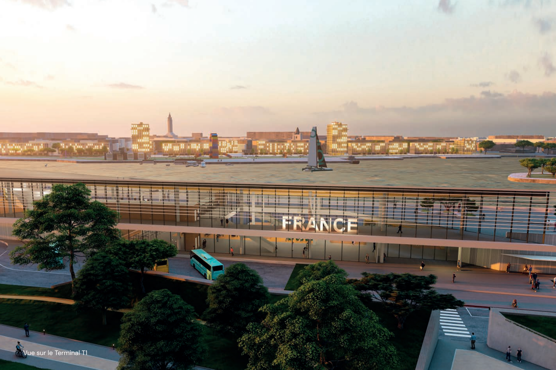
Vue sur le Terminal T1