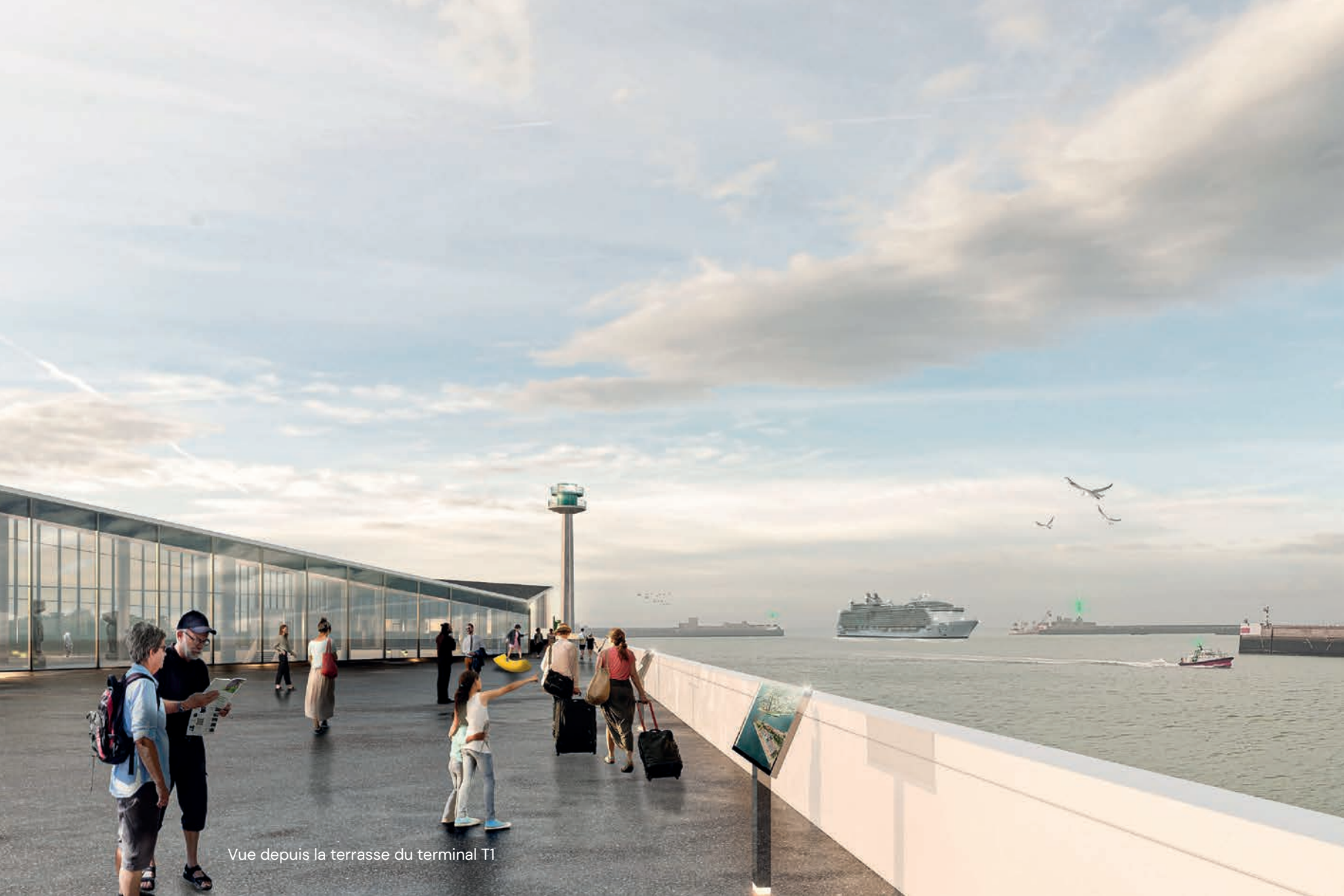
Vue depuis la terrasse du terminal T1