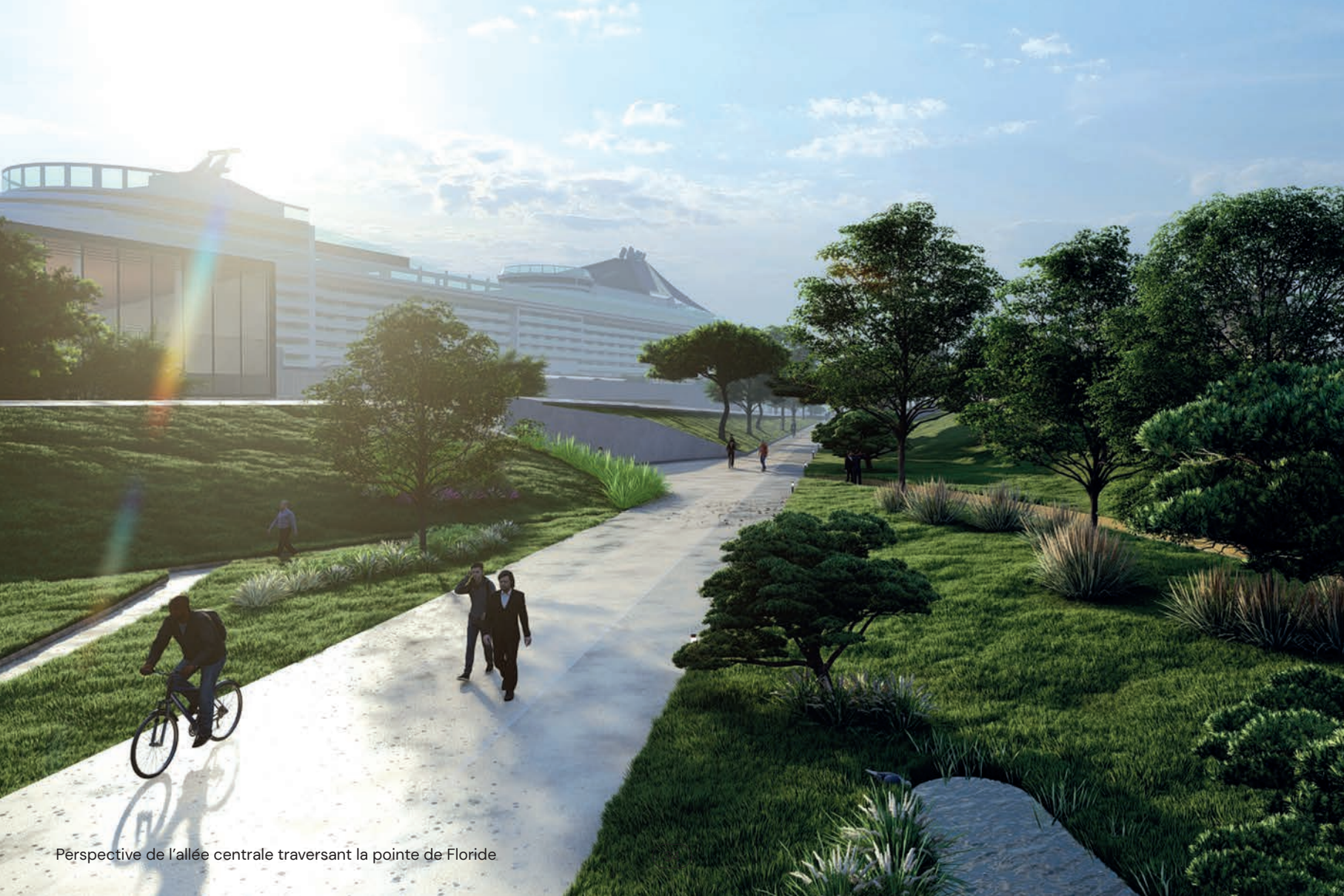
Perspective de l'allée centrale traversant la pointe de Floride