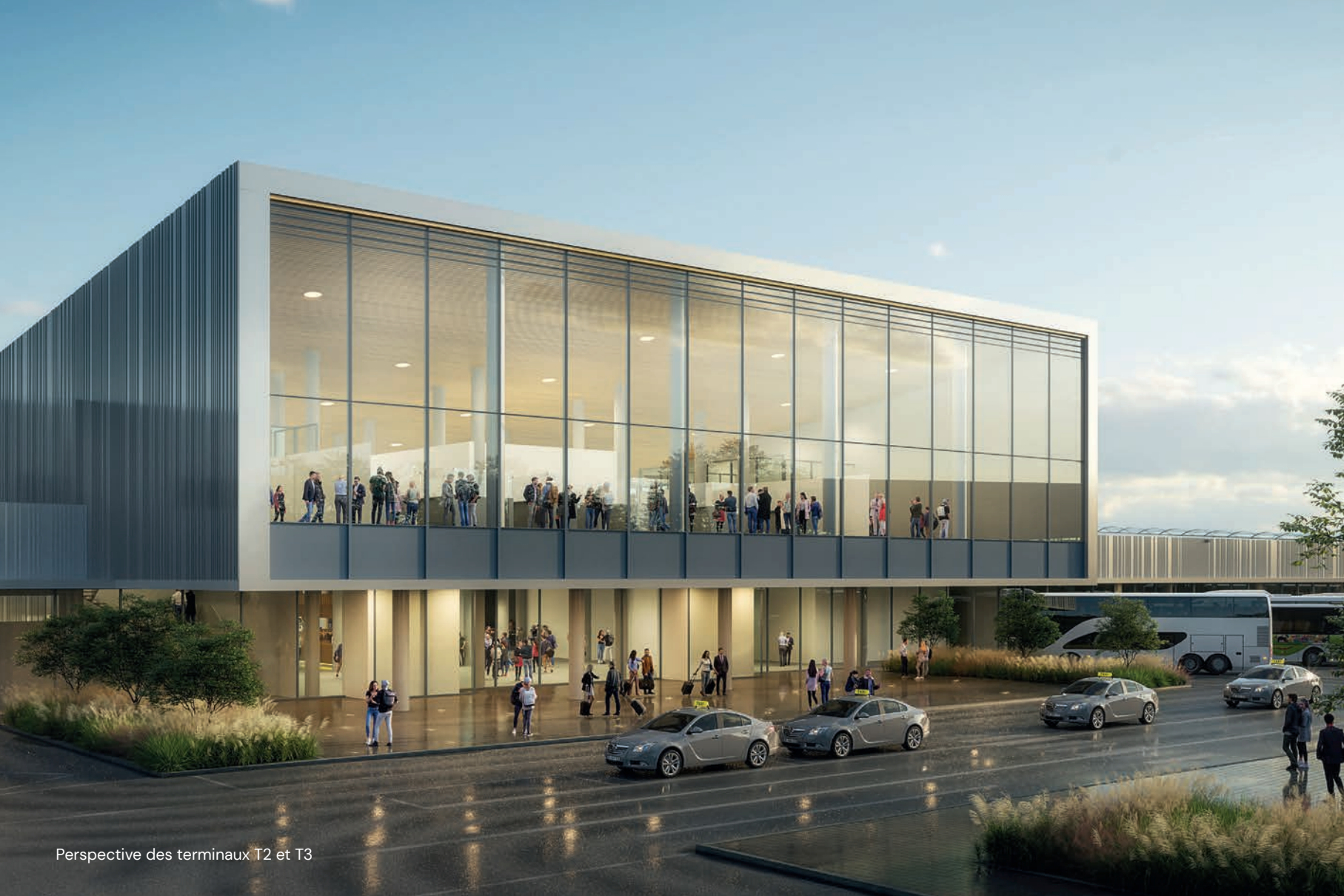
Perspective des terminaux T2 et T3