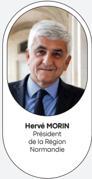
Hervé MORIN Président de la Région Normandie

La Région Normandie est particulièrement fière d'accompagner, à hauteur de 15 millions d'euros, Le Havre Croisières dans son projet visant à aménager la pointe de Floride ainsi que trois nouveaux terminaux dans le but de hisser le port du Havre, second port de croisière français après Marseille, au niveau des plus grands ports européens du secteur.