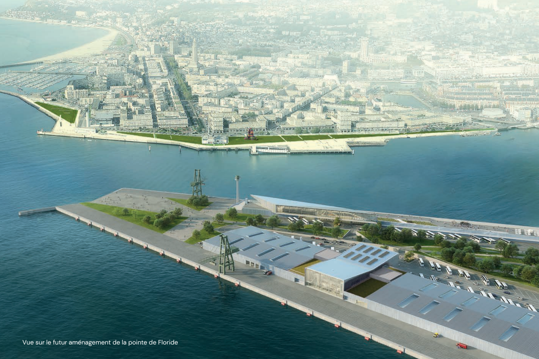
Vue sur le futur aménagement de la pointe de Floride