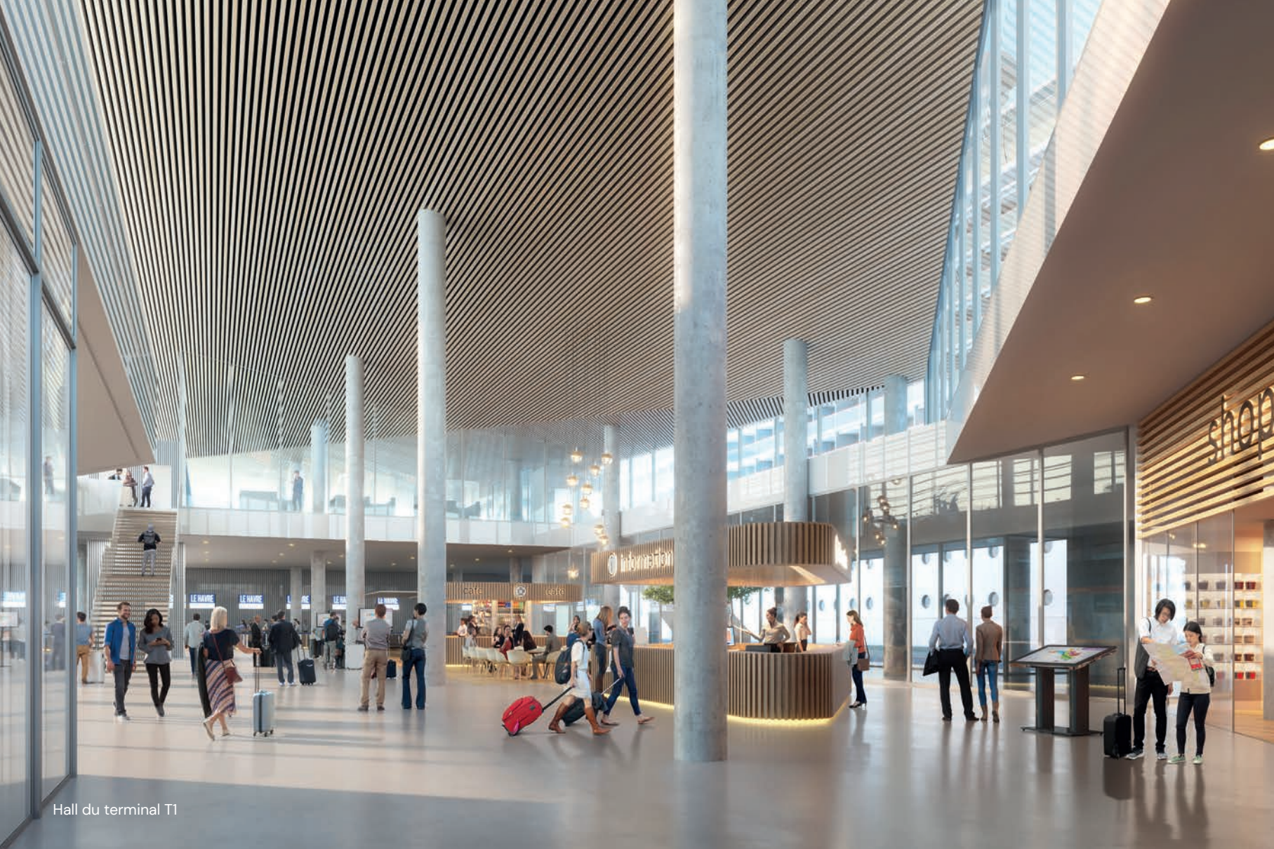
Hall du terminal T1