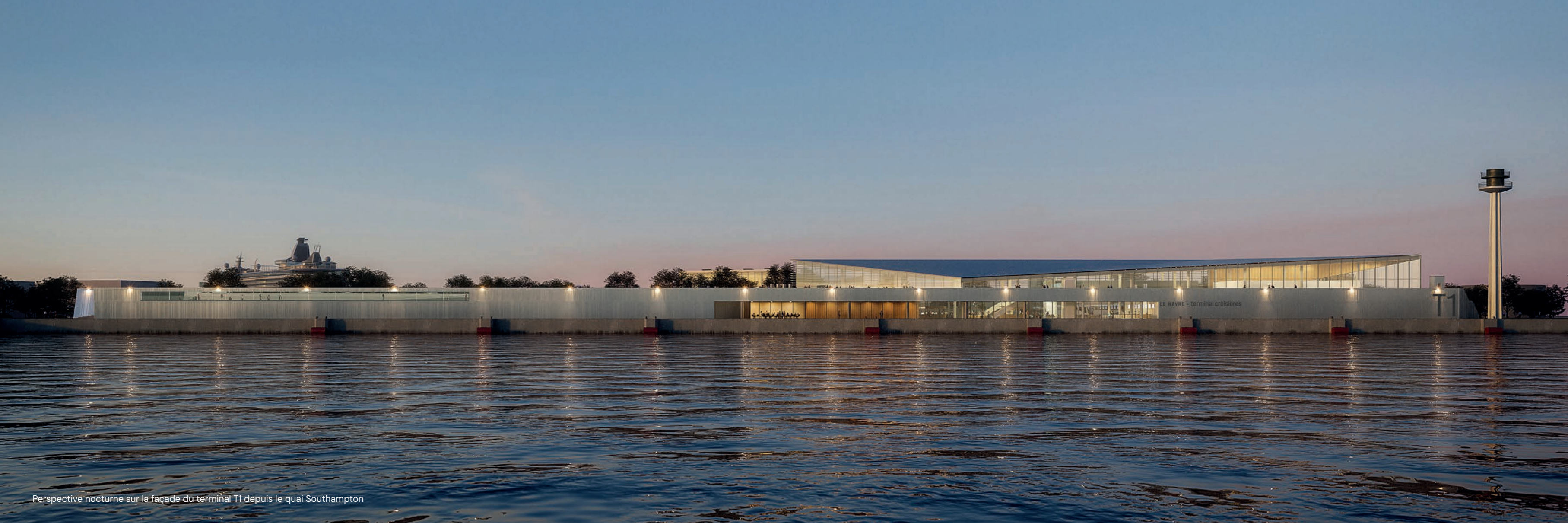
Perspective nocturne sur la façade du terminal T1 depuis le quai Southampton