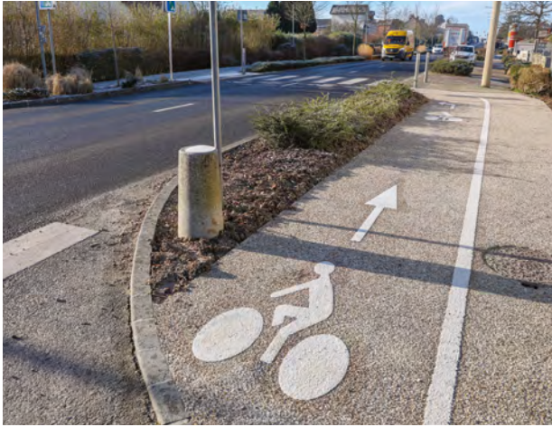
De nouveaux aménagements pour les cyclistes à Saint-Romain-de-Colbosc