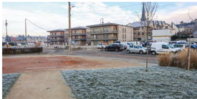
Le secteur de l'ancienne Poste à Octeville-sur-Mer

La ville d'Octeville-sur-Mer a souhaité densifier son centre-bourg sur trois secteurs, dont celui de la place de l'ancienne Poste. La requalification de l'espace public autour des rues Abbé-Jean-Ribault, Fafin, René-Coty et Verdun ainsi que de la place Maréchal-Foch s'effectue en miroir des programmes immobiliers (67 logements et trois commerces) qui y sont