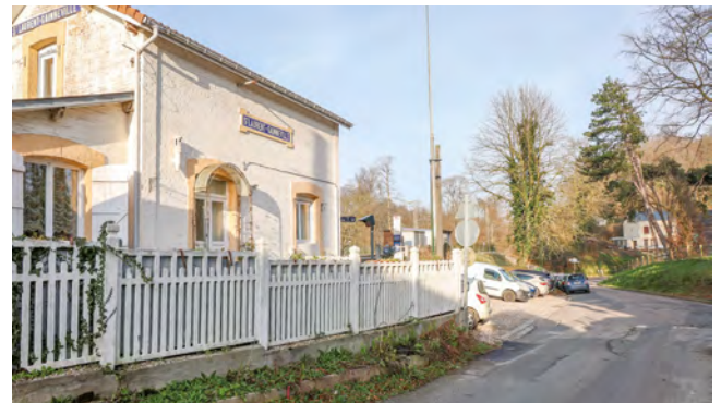
Les accès à la halte ferroviaire bientôt réaménagés

À partir de l’été 2025, la halte ferroviaire de Saint-Laurent - Gainneville va bénéficier d’aménagements destinés à améliorer l’accueil des usagers et favoriser leur stationnement, tous