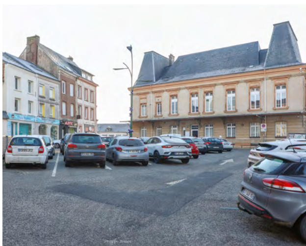
À Criquetot-l'Esneval, la place Georges-Chedru prépare sa mue.

Le projet d'aménagement des places Georges-Chedru et Général-Leclerc débutera en juin 2025. Il permettra d'améliorer l'accès aux commerces et la cohabitation des différents usagers du centre-bourg (piétons, cyclistes, automobilistes), avec une grande place accordée aux piétons. Ce projet, qui devrait être livré en septembre 2025, prévoit de végétaliser davantage l'espace public et mettre en valeur le patrimoine communal.