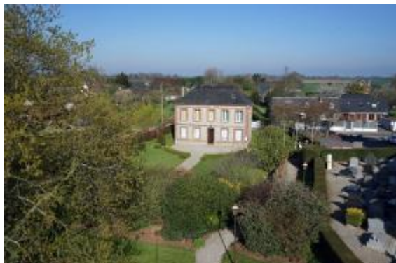
Mairie de Vergetot Jacques Refuveille