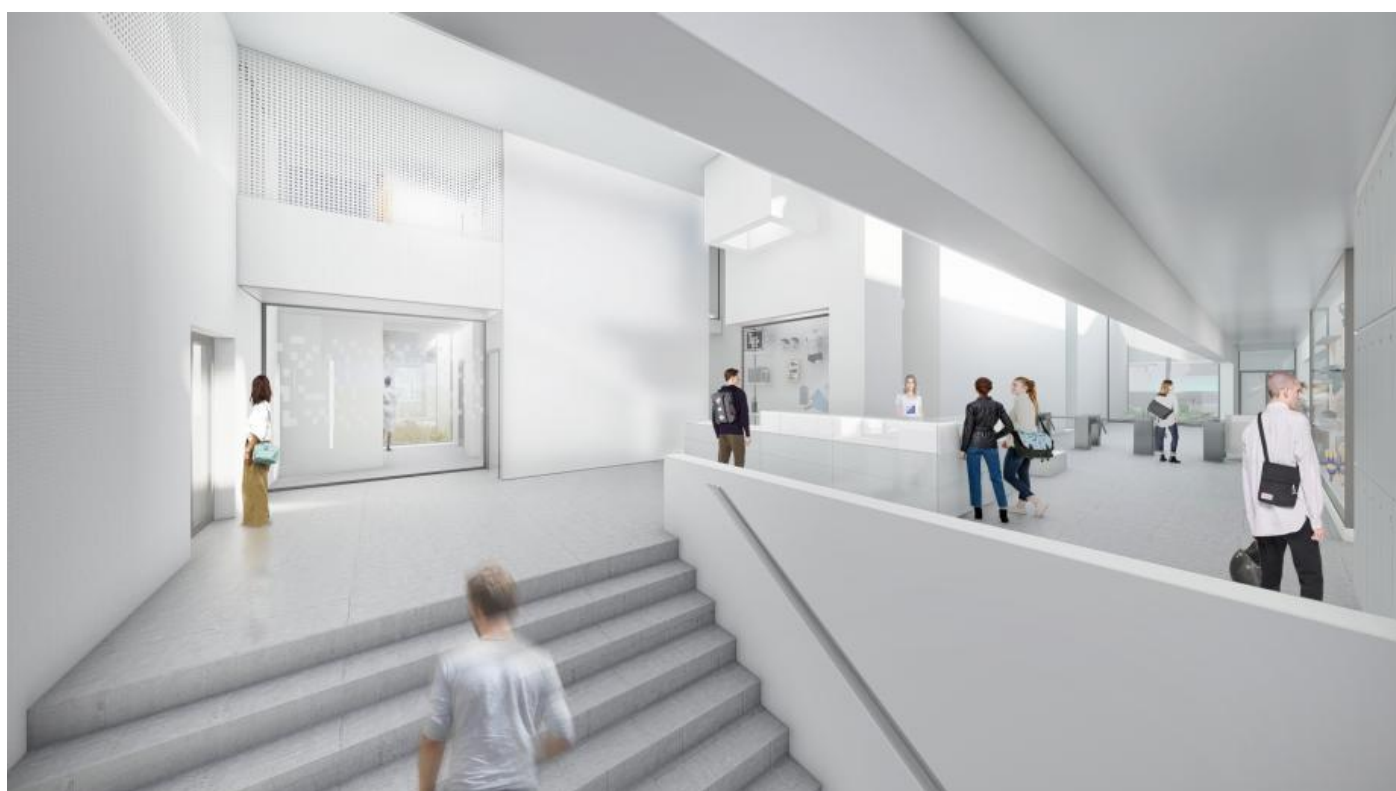
Projet d'aménagement de l'espace d'accueil aux Bains des Docks ©A26 ARCHITECTURE

Afin de faciliter la circulation des abonnés au sein des Bains des Docks, l'espace d'accueil sera reconfiguré avec la création d'un escalier « multi-pass », permettant de circuler des vestiaires fitness jusqu'aux bassins sportifs et à l'espace balnéothérapie pieds nus et sans avoir à changer de vestiaire.