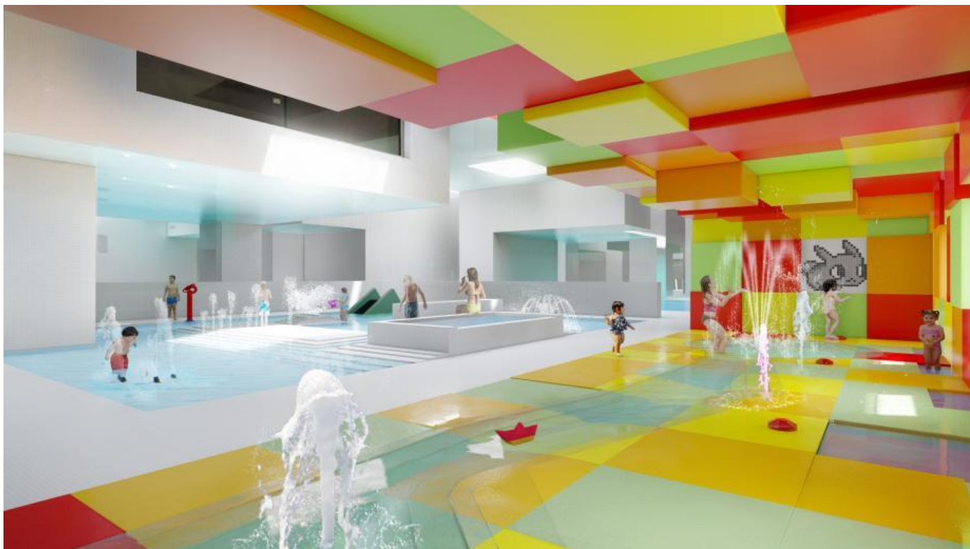
Projet d'aménagements ludiques pour les enfants aux Bains des Docks ©A26 ARCHITECTURE

La pataugeoire sèche avec les cubes de couleur ainsi que le bassin pour enfants seront enrichis de jeux interactifs.