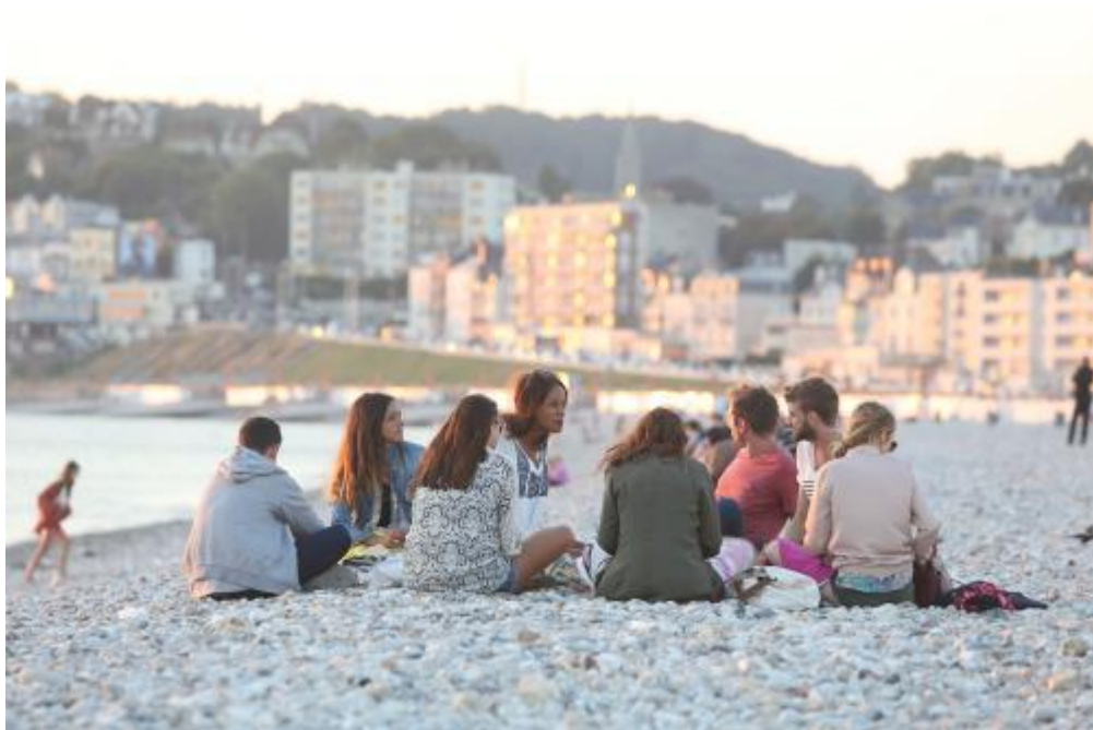
Étudiants sur la plage du Havre