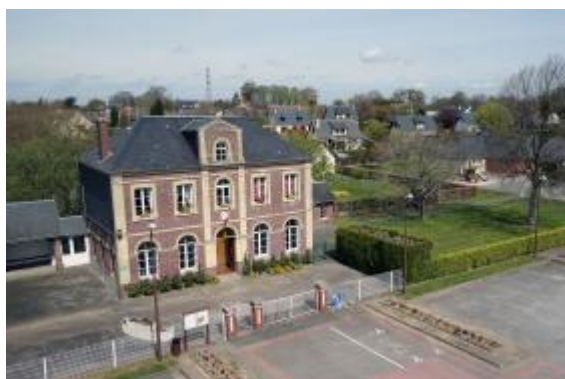
Mairie de Saint-Vincent-Cramesnil Jacques Refuveille