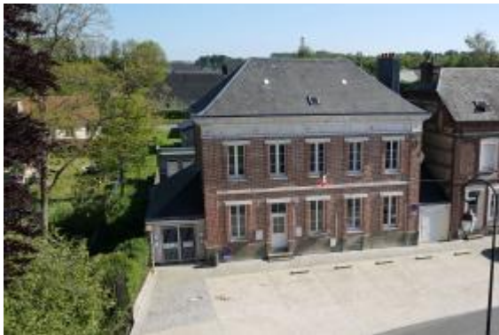
Mairie de Saint-Gilles-de-la-Neuville Jacques Refuveille