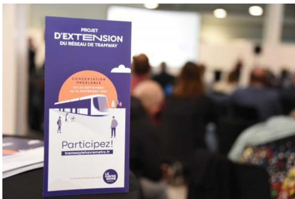
Réunion publique dans le cadre de la concertation pour le projet de tramway

Le projet d'extension du réseau de tramway a fait l'objet d'une concertation préalable du 22 septembre au 16 novembre 2021 organisée par la communauté urbaine Le Havre Seine Métropole, maître d'ouvrage, sous l'égide de Dominique PACORY et Bruno BOUSSION, garants nommés par la Commission nationale du débat public (CNDP).