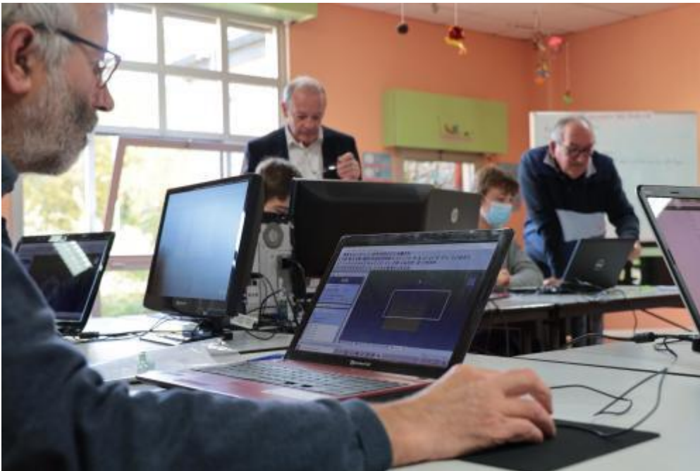
FabLab de Montivilliers

et d'apprendre, exerçant une douzaine de métiers, de tailleur de pierre à restaurateur, d'électricien à superviseur dans le raffinage, de formateur en sécurité industrielle à plombier. « C'est cette même envie de partager les savoirs qui a animé mon désir de créer le FabLab, où j'accueille aussi des scolaires et collégiens pour susciter des vocations. »