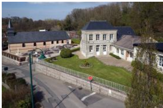
Mairie de Notre-Dame-du-Bec Jacques Refuveille