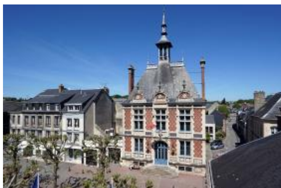
Mairie de Montivilliers Jacques Refuveille