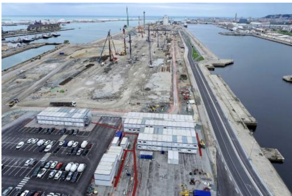
Le futur site éolien prêt à sortir de terre

Depuis 15 ans, Port 2000 permet au Havre d'accueillir les plus grands navires de commerce jamais construits, sans contraintes de marée. Actuellement, d'importants travaux de gros-œuvre sont en cours pour achever ce port rapide et mettre à disposition 700 m de quai supplémentaires. En 2024, les nouveaux postes à quai porteront leur nombre à 14. Ils fluidifieront d'autant mieux la manutention des conteneurs destinés aux marchés français ou internationaux qu'une autre réalisation – la chatière, accès fluvial direct aux terminaux de Port 2000 – devrait elle aussi être achevée à cette date.