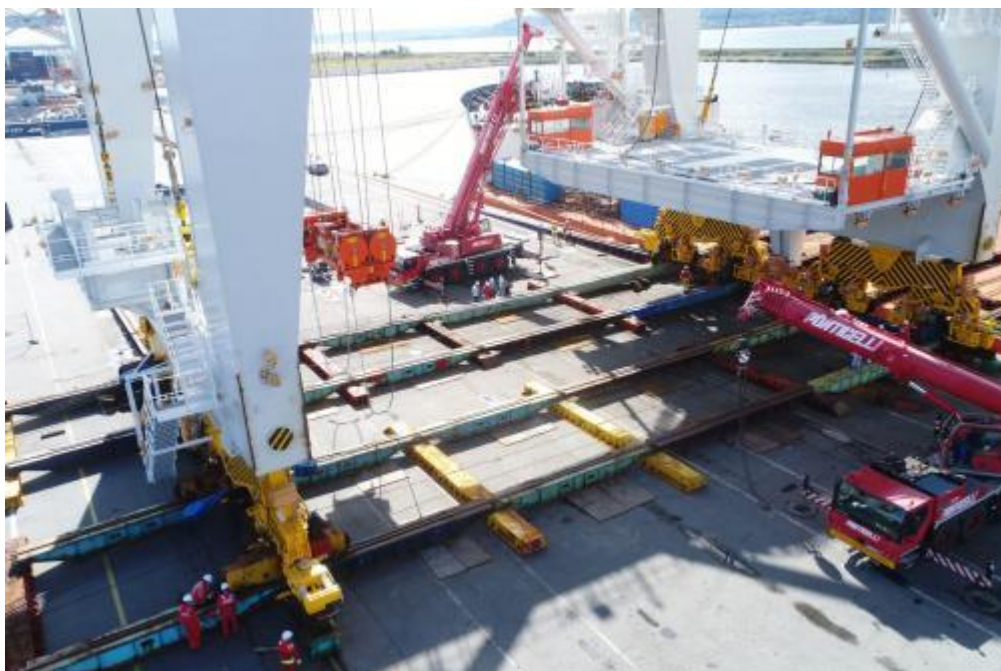
Déchargement des quatre portiques géants livrés en juin 2020