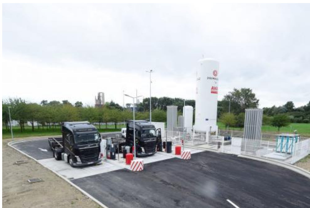
Une nouvelle station au gaz naturel pour les poids lourds

Autre bonne nouvelle, l'implantation au Havre de l'armateur TransOceanic Wind Transport (TOWT) qui prévoit le lancement dès 2022 de premiers cargos à voile. Le port du Havre incite ces modes de propulsion vertueux en instaurant des exonérations ou ristournes sur les droits de port : un facteur de compétitivité qui peut inciter les armateurs à privilégier la place havraise dans leurs circuits transocéaniques.