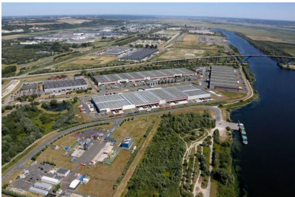
Les parcs logistiques du pont de Normandie

mer. Il s'agit du plus important plan industriel dédié à la production d'énergies renouvelables de l'histoire en France et d'une première mondiale dans l'histoire de l'industrie éolienne : sur un même site le long du quai Joannès Couvert, les activités d'assemblage seront couplées aux opérations portuaires pour l'acheminement et l'installation de plusieurs projets éoliens au large des côtes françaises. Le programme éolien en mer ayant vocation à devenir un pilier de notre système énergétique, le site havrais deviendra une vitrine de l'innovation industrielle et générera environ 750 emplois directs et indirects.