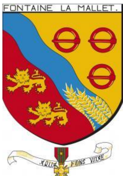
Blason de Fontaine-la-Mallet