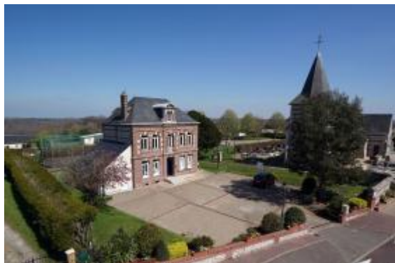
Mairie de Cuverville Jacques Refuveille