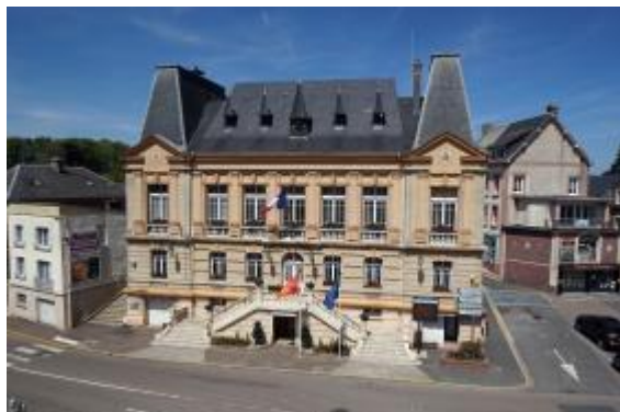
Mairie de Criquetot-l'Esneval Jacques Refuveille