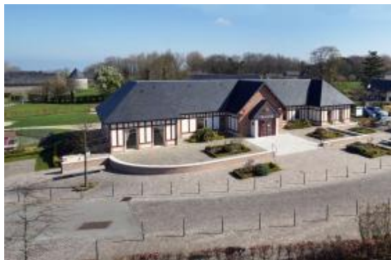
Mairie de Cauville-sur-Mer Jacques Refuveille