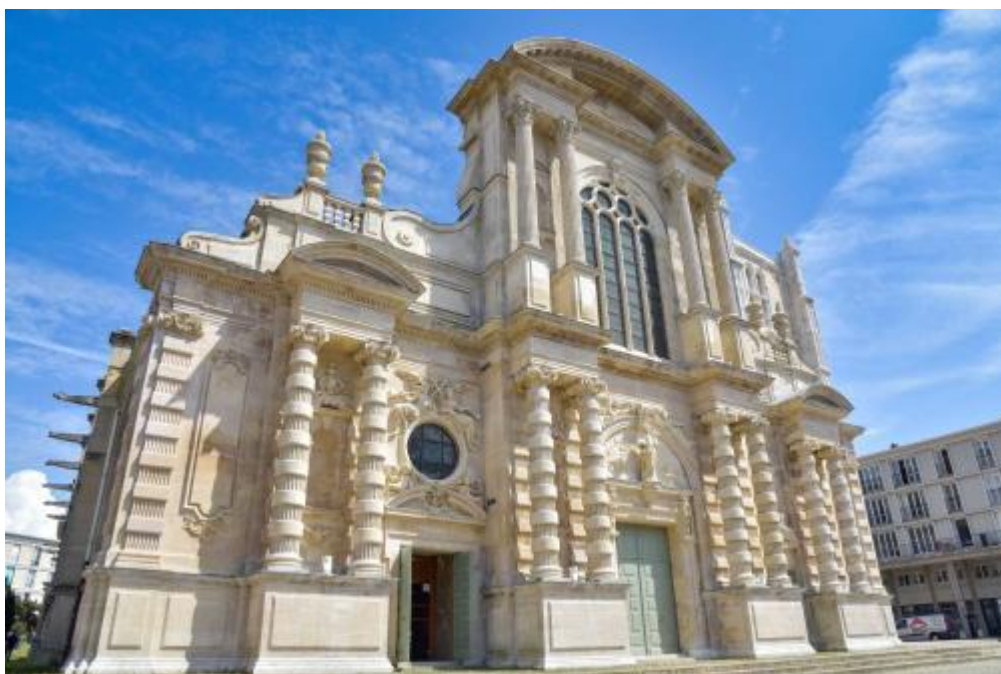
Cathédrale Notre-Dame, Le Havre

Comme chaque année, des lieux inaccessibles au cœur des quartiers du Havre ouvriront exceptionnellement leurs portes au public : la gare basse de l'escalier Montmorency (n°40), la rotonde de Graville (n°47) ou encore le bureau du maire du Havre (n°21).