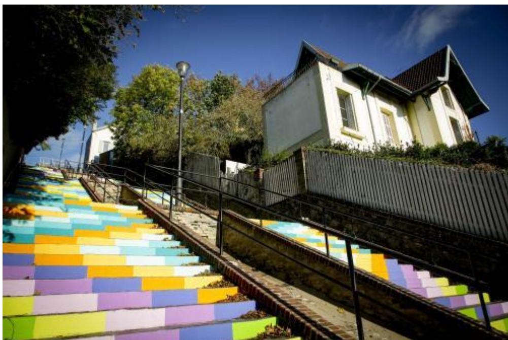
Escalier Montmorency, Le Havre

Vous pouvez aussi filtrer l'offre des visites par date et par thème : patrimoine civil, patrimoine de la reconstruction, patrimoine maritime et portuaire, patrimoine militaire, patrimoine religieux et spirituel et patrimoine scolaire du 1 er degré.