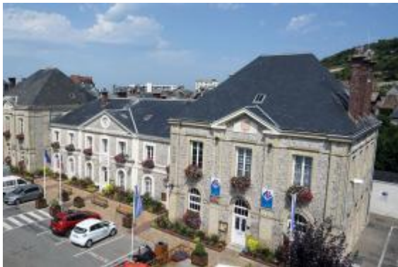
Mairie d'Étretat Jacques Refuveille